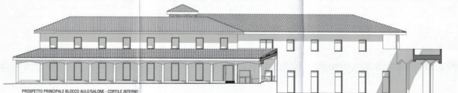
PROSPETTO PRINCIPALE BLOCCO AULE/SALONE - CORTILE INTERNO