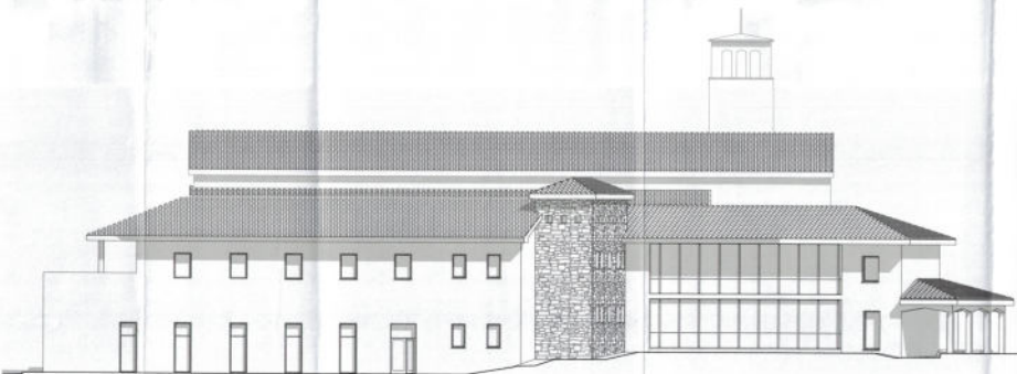
PROSPETTO LATO PARCO